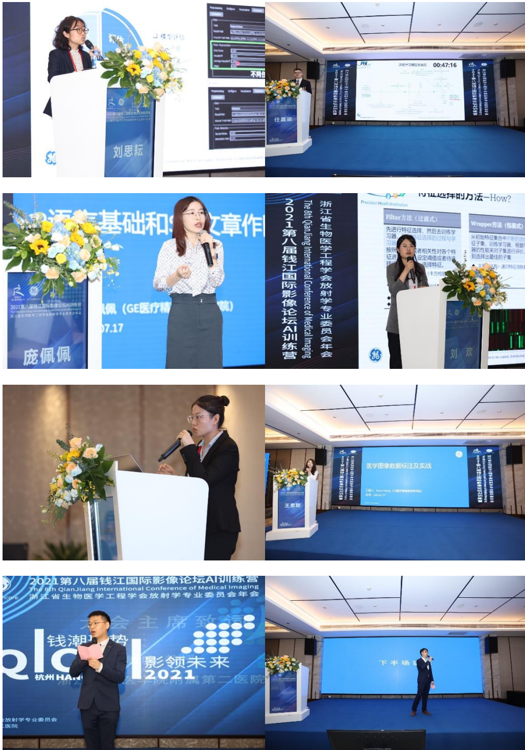
GE 医疗精准医学研究院团队

授课结束后，大会秉承公平公正公开的原则，组织随堂测试，并现场公布成绩。张敏鸣教授主持闭幕式，共评选颁发 1 等奖 1 名，二等奖 3 名，三等奖 3 名。