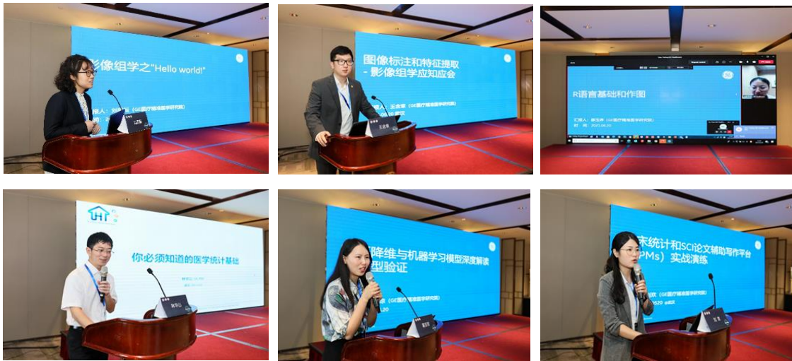
GE 医疗精准医学研究院团队

授课结束后，大会秉承公平公正公开的原则，组织随堂测试，并现场公布成绩，共评选颁发1等奖1名，二等奖3名，三等奖3名。