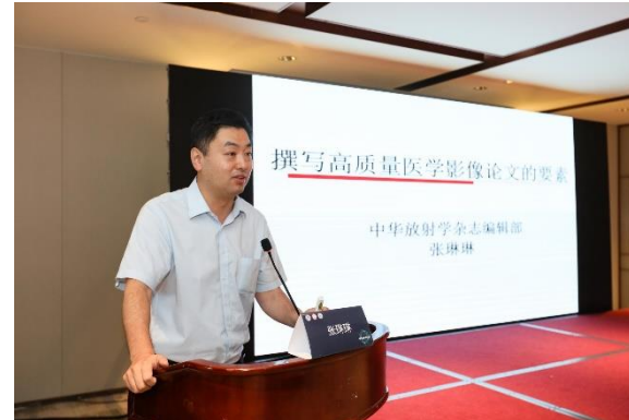
中华放射学杂志 张琳琳